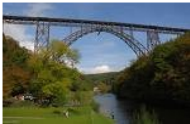
Le Pont de Müngsten

C'est un vrai plaisir de voyager à 107 mètres de hauteur et réjouissez-vous de la vue qu'offrent les collines, les vallées et les forêts de Remscheid. Le pont de Müngsten a une longueur totale de 500 mètres, la portée de son arche est de 170 mètres et, lorsque la voûte fut édifée le 21 mars 1897, quelques 950 000 rivets avaient été appoés sur l'immense construction de fer! Il est dès lors peu étonnant que le Pont de Müngsten dont le coût s'est élevé à 2,64 millions de Reichsmark, ait par exemple servi de modèle pour le pont routier surplombant les chutes du Niagara à la frontière entre les USA et le Canada.