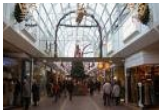
Allee Center : intérieur

Shopping et musées, chemins de randonnée dans la nature et torrents grondants, possibilités attractives de sport et de loisirs. Remscheid, la ville industrielle au coeur du Bergisch Land [«le Pays des Comtes de Berg»], présente de nombreuses facettes.