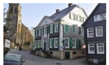
Deutsches Röntgen Museum

L'inventeur des "nouveaux rayons" a donné son nom au musée allemand de la radiographie, dit Deutsches Röntgen Museum, fondé en 1930 et situé dans la vieille ville de Lennep. Sur une surface d'exposition de 2600 m 2 il présente une collection unique dans le monde d'instruments d'application des rayons X. Le musée "Deutsches Röntgen Museum" comprend également un café et une boutique avec des documents d'informations, des livres, des diapositifs et toutes sortes de souvenir.